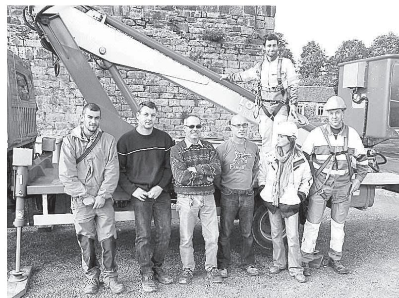
Les stagiaires et leur formateur.

Apprentissage de la conduite d'une nacelle