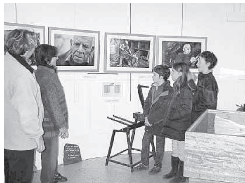
L'exposition se découvre facilement en famille, ou entre amis, avec des explications sur place.

L'histoire de l'ardoise se découvre et se raconte