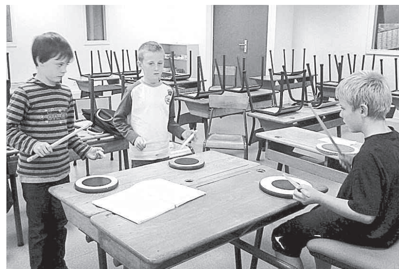
Il n'y a pas d'âge pour s'inscrire au bagad Douar Ha Mor. Ici, trois garçonnets futurs batteurs du groupe folklorique richardaisien.