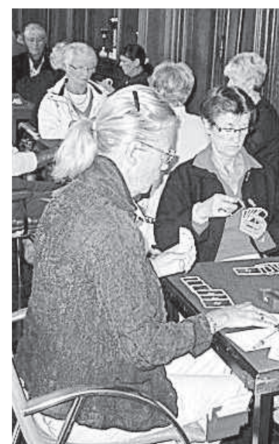
Les inconditionnels n'ont pas attendu la rentrée des classes pour s'adonner à leur sport favori.