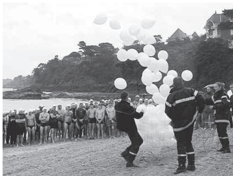
Lâcher de ballons, pour lancer le challenge Ludovic-Martin.