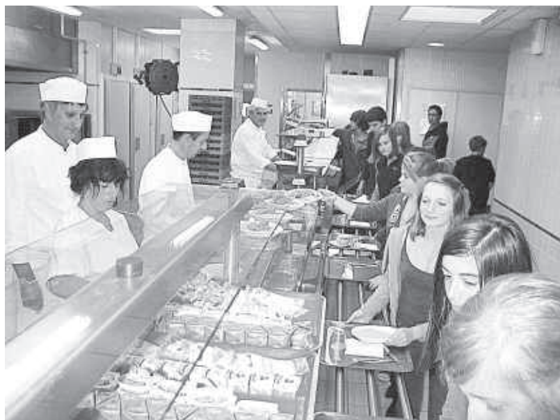
Enfin, une nette majorité se déclare pour un collège à taille humaine. À la restauration, les sourires semblent apprécier les petits plats.

« Les travaux devraient débiter vers la fin 2012 et durer environ un an. » À condition que l'on s'accorde sur un projet. Car il reste deux architectes en lice. Il faudra donc choisir, engager les procédures administratives et lancer les consultations. Sous réserve aussi que l'on rentre dans l'enveloppe budgétaire. Là encore, les parents manifestent : « Les erreurs administratives ont non seulement